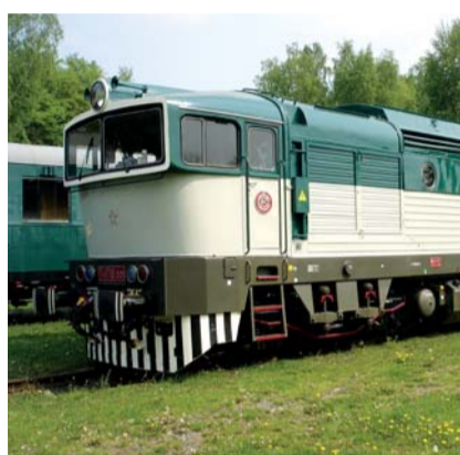
T 4783 „Brejlovec“