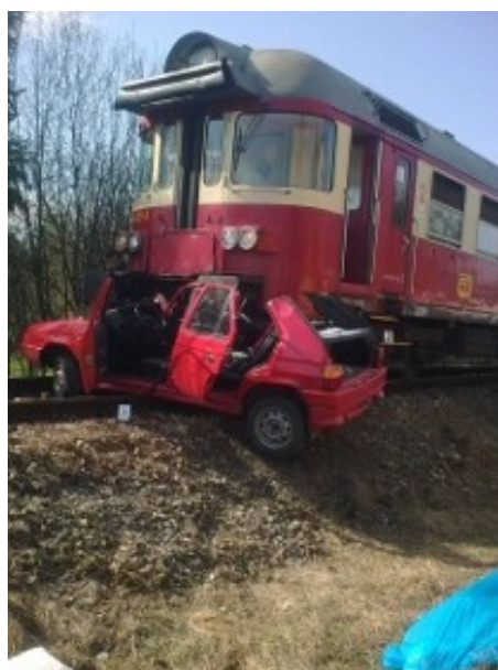
Fotografie ze střetnutí na přejezdu v Bakově nad Jizerou.

Drážní inspekce dlouhodobě upozorňuje na rizika spojená s pohybem v okolí železnice, která mohou přinést následky nejzávažnější (smrt). V souvislosti s aktuálními událostmi na železničních přejezdech, kdy dochází k úmrtím a zraněním osob i značným škodám na majetku v rámci následků, Drážní inspekce apeluje nejen na všechny řidiče , ale i všechny uživatelé pozemních komunikací , aby respektovali zákon a v době, kdy je na železničním přejezdu dávana světelným zabezpečovacím zařízením výstraha, v žádném případě nevjíždějí/nevstupovali na železniční přejezd a u železničních přejezdů s výstražnými kříži se přesvědčili, že mohou bezpečně přes koleje přejít/přejít.