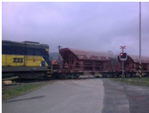
Fotografie ze střetnutí na přejezdu v Bohdíkově na Šumpersku.