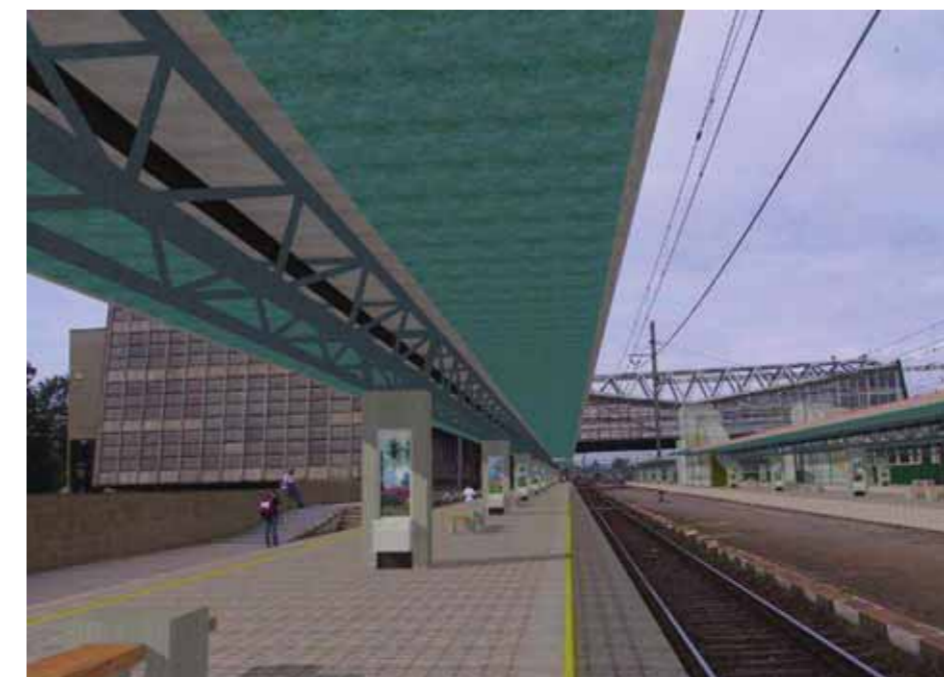
Modernizácia sa týka aj niektorých železničných staníc. Vizualizácia železničnej stanice Poprad-Tatry.