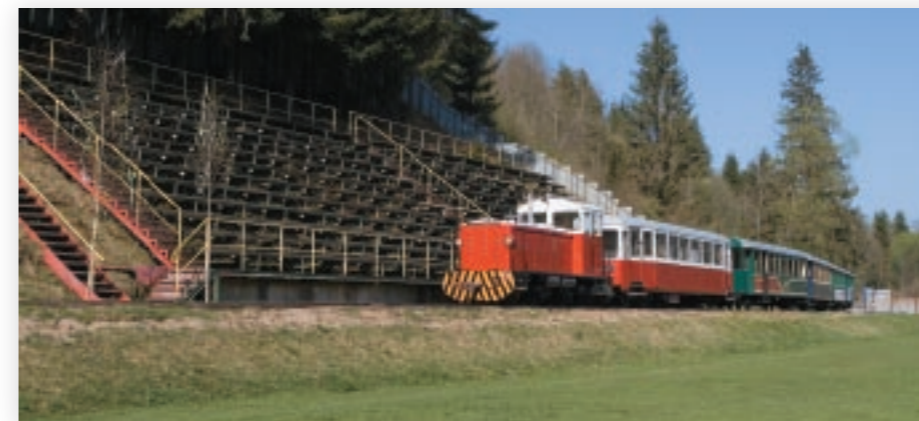
Obnovená trať ČHŽ v Čiernom Balogu, v časti Jánošovka, prechádza medzi tribúnou a ihriskom, čo je európska rarita. Železnica sa tak bude využívať aj na prevozy fanúšikov a športovcov na futbalové zápasy.