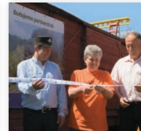
Otváraciu pásku prestrihla starostka obce Nagybörzsöny spolu s riaditeľom ČHŽ a majiteľom firmy Korekt, s. r. o.