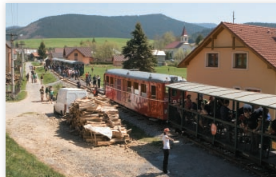
Do čiernobalockej osady Dobroč sa po takmer 30-tich rokoch vrátili vlaky. Čierny Balog so svojím železničným dopravným systémom môže časom pripomínať vyspelé Švajčiarsko.