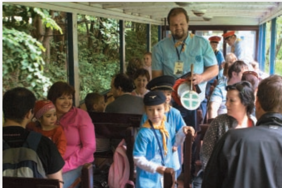
Vo vlakoch KDHŽ je možné stretnúť aj malých železničiarov. Kontrolujú lístky a rozdáujú radosť.