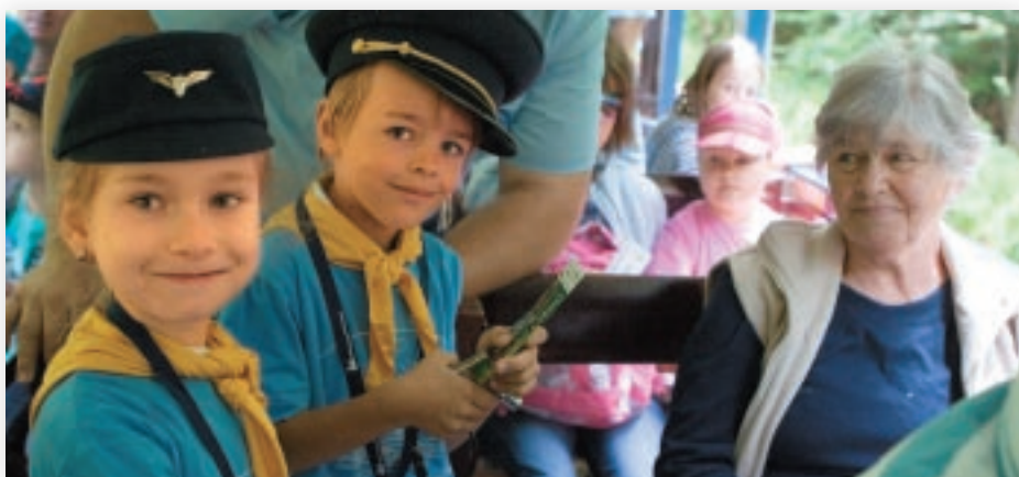
Návrat malých „železničiarov“ do čermeľského údolia je jedným z prvých krokov občianskeho združenia Detská železnica Košice.

Magazín priateľov a cestujúcich Košickej detskej historickej železnice