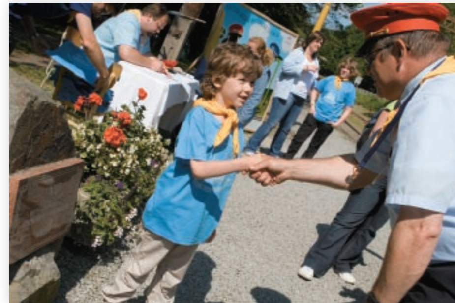
Deti zapísané do Klubu mladých železničiarov boli pri malom pamätníku detskej železnice slávnostne dekorované tričkom s nápisom Mladý železničiar a šatkou KDHŽ.

Originálnou akciou na KDHŽ bola burza kníh. Vagón literatúry na stanici v Čermeli lákal pozornosť a spríjemňoval čakanie na vlak.